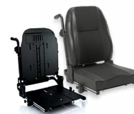
ASA 2172 bzw. 2173