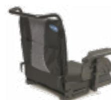
2110 / 2161