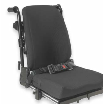
ASA 2174, 2175