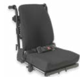
ARH 2174, 2175