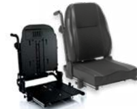
ARH 2172 bzw. 2173