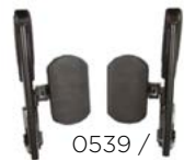
0539 / 0549