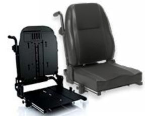
Rücken: ARJ 2172 bzw. 2173