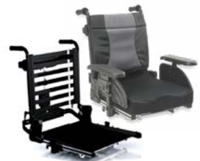
Rücken: ARJ 2171