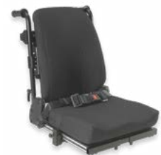
Rücken: ARJ 2174, 2175