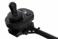
2231 / 2232